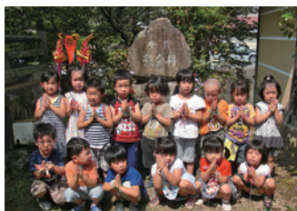
平和の集い（原爆の日に合わせて）