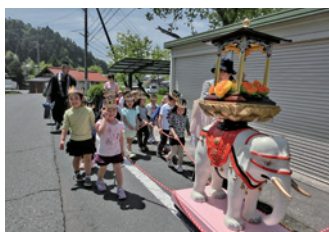
ポーシャクんとパレード

碎啄同時（そったくどうじ）という言葉があります。とりが卵を温め孵化（ふか）するとき、殻の中を「じっと」うかがいます。そして時がきて中から出ようとして雛が啄（つつ）き、同時に親鳥が碎いて新しい命が誕生します。こんな気持ちで、一人ひとりの乳幼児をおあずかりし、豊かに大きくその才能を育ててあげたいと願っています。